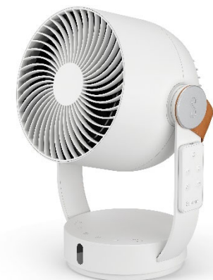
UVP 109,00 €