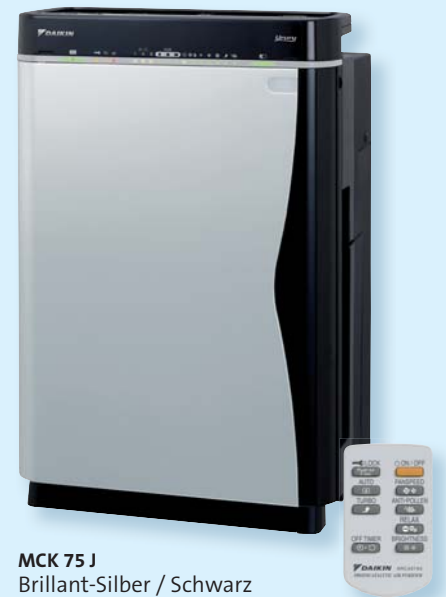
MCK 75 J Brillant-Silber / Schwarz