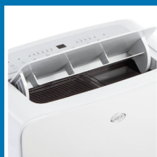
Flap motorizzato Auto-opening flap