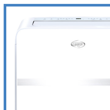
Cura dei dettagli Attention to details