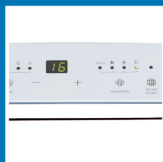
Pannello comandi digitale con display a LED Digital control panel with LED display

"Filter reset" function guarantees excellent air quality, the air conditioner indicates when to clean the air filter.