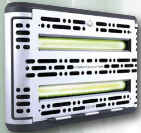
Independent efficacy trials...

3 Jahre Garantie (Röhren und Klebefolie ausgenommen)